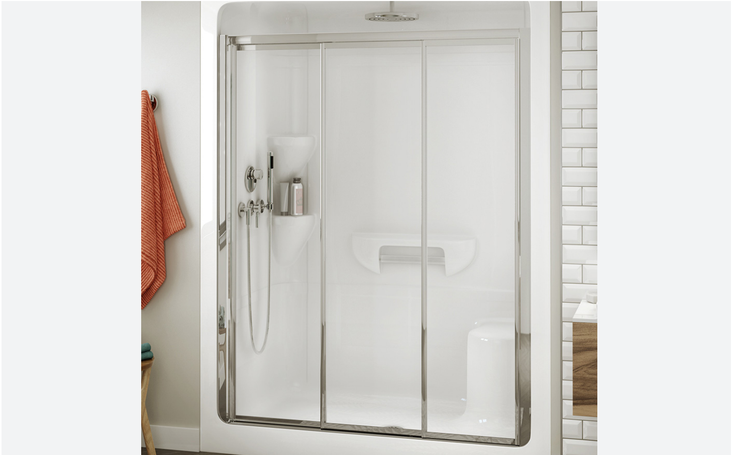
Model shown / Modèle présenté : SS-51SL-3-LOM PA